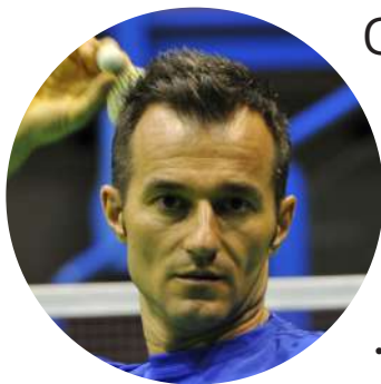
di Fabio Morino*

Cognitiva, associativa, autonoma: ecco le tre fasi per acquisire le abilità nel movimento. Senza i fondamentali non si arriverà mai al top