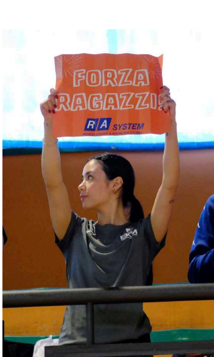
Una tifosa del BC Milano

Un play-off scudetto che parte senza grosse novità, quello che si disputerà a Milano l'11 e il 12 maggio. Le quattro formazioni qualificate sono le stesse della precedente edizione. A cambiare sono invece la posizione in regular season e gli equilibri, che hanno visto un continuo alternarsi nelle prime tre posizioni e di conseguenza un'inversione delle semifinali.