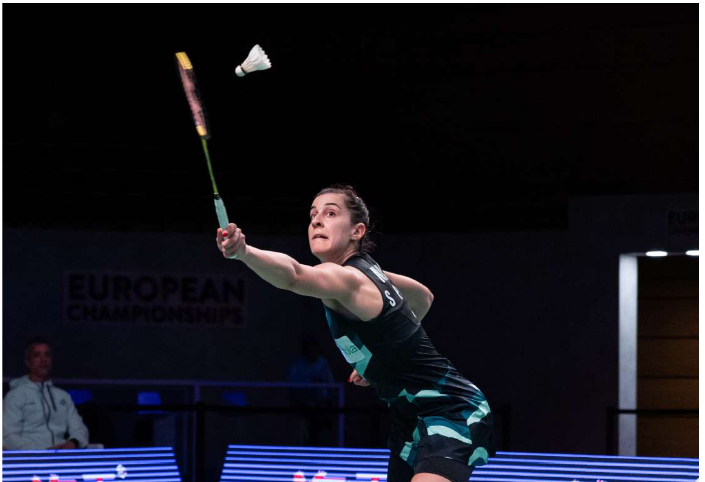
Carolina Marin in azione

argenti nei doppi e quattro bronzi, confermandosi la nazione regina del badminton europeo. Gli argenti