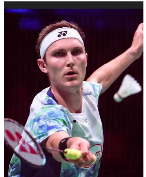
Il leader mondiale Viktor Axelsen

posizioni del ranking mondiale. Ma anche in questo caso bisognerà attendere le decisioni del NOC australiano.