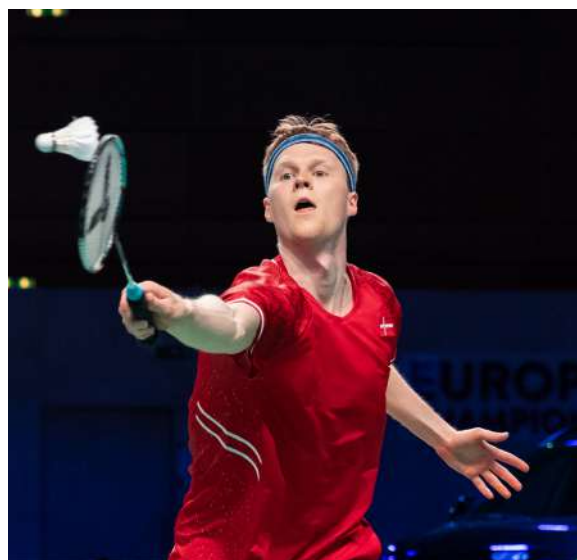
Anders Antonsen ha vinto il singolare maschile