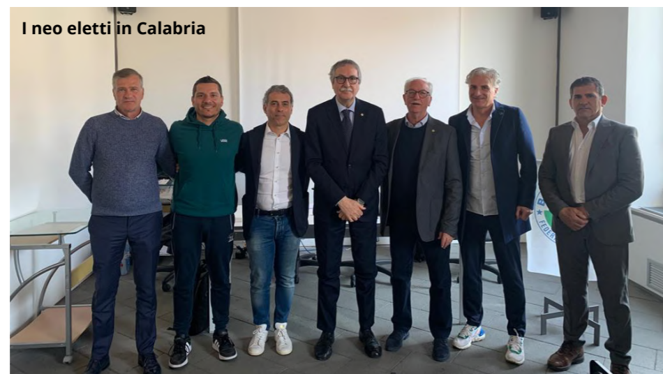
I neo eletti in Calabria