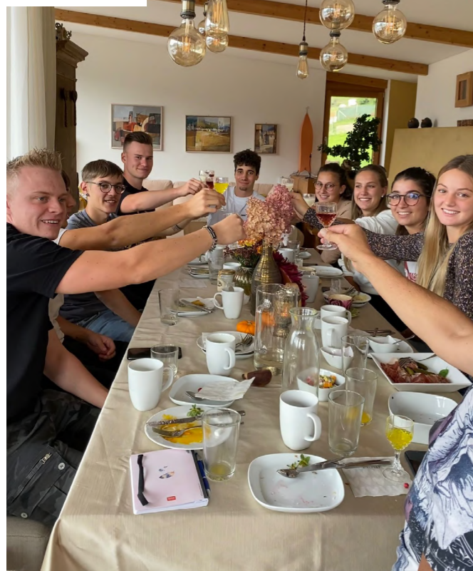
A pranzo con gli amici di sempre