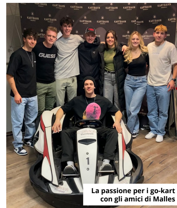
La passione per i go-kart con gli amici di Malles

passare il girone, arrivare ai quarti di finale e magari prenderci pure una medaglia. Ce la possiamo fare, anche se danesi, francesi