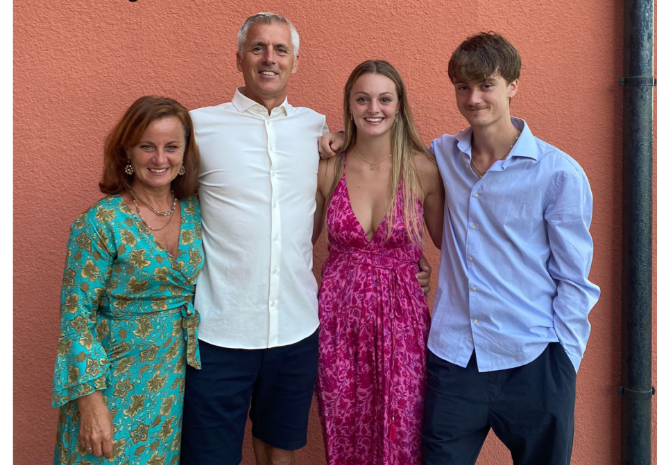
Foto di famiglia

“Siamo legatissimi, siamo cresciuti insieme quando eravamo piccoli ed è per merito suo che mi è venuta voglia di competere a livello internazionale. Lo guardavo giocare