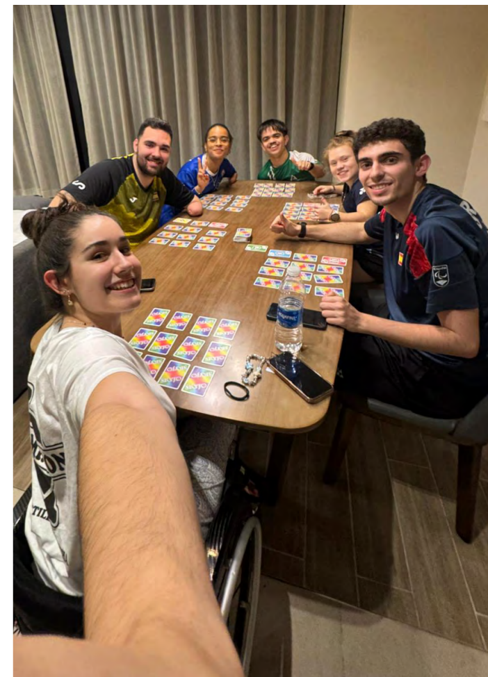
Mentre gioca a carte in Bahrain con colleghi di altre nazioni