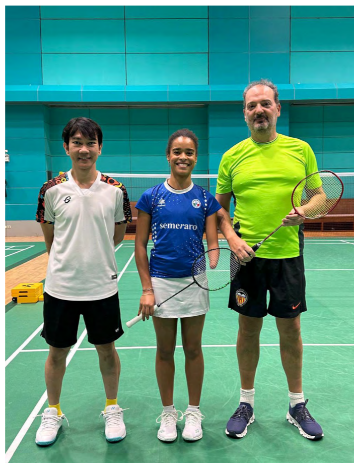
Con l'ambasciatore italiano in Thailandia (a dx) con cui ha fatto qualche scambio