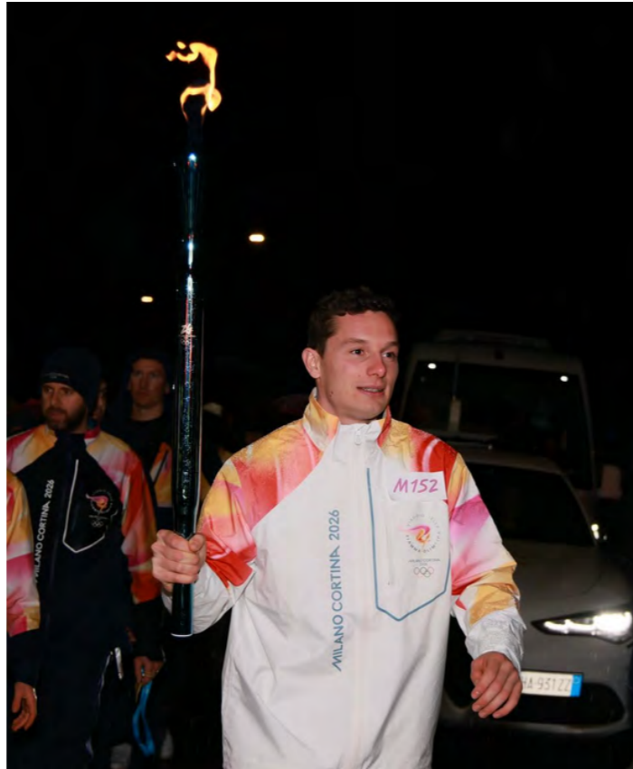
Tedoforo a Milano-Cortina 2026

“Già, forse è più da mezzofondisti, ma anche gli sprinter hanno bisogno di regolarità. Semmai è la durata che non è proprio dalla nostra”.