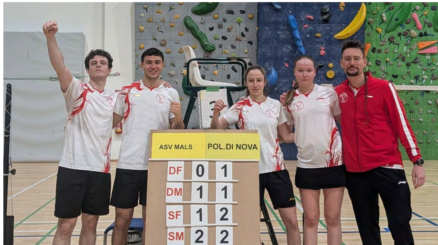
La Pol. di Nova, squadra rivelazione della stagione