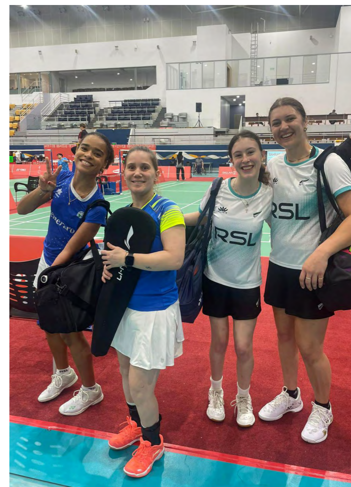
Dopo un allenamento a Bangkok