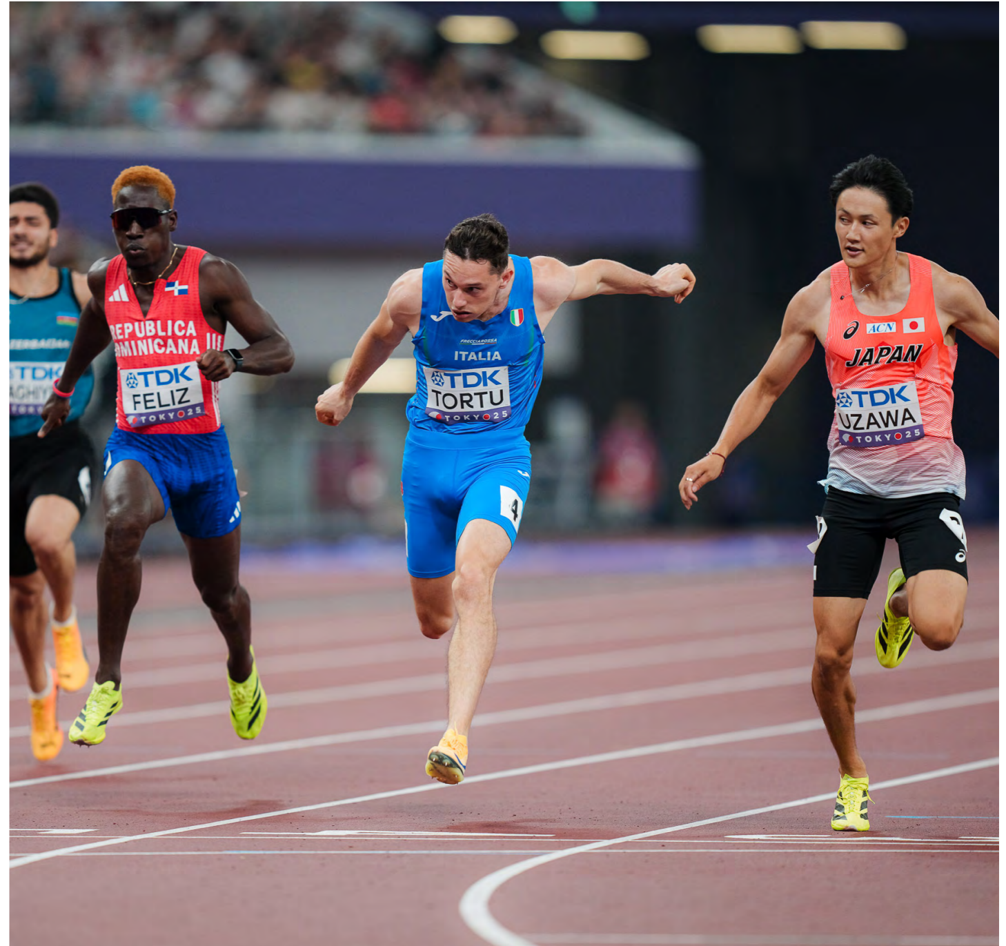
Tortu sui 200 agli ultimi Mondiali di Tokyo

“Triste. Quantomeno non sarei stato così felice. Il momento in cui sono più felice è appunto quello in cui competo e pratico sport, sia il mio che qualsiasi altro. Che possa essere il badminton o le freccette. Nuotare, nell'ultimo periodo, per esempio mi ha aiutato molto”.