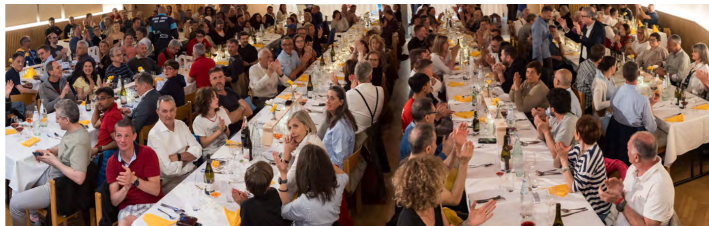
Una panoramica della festa per i 50 anni dell'ASV Mals