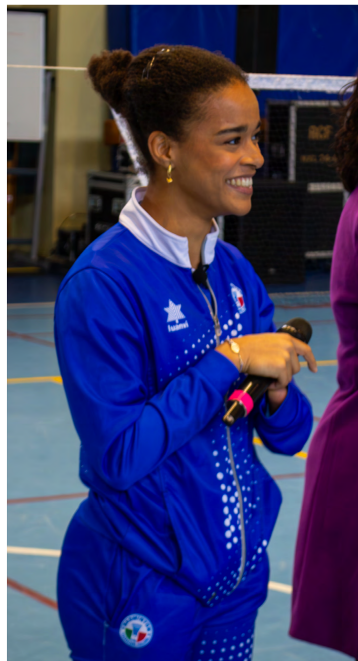
Un bel primo piano