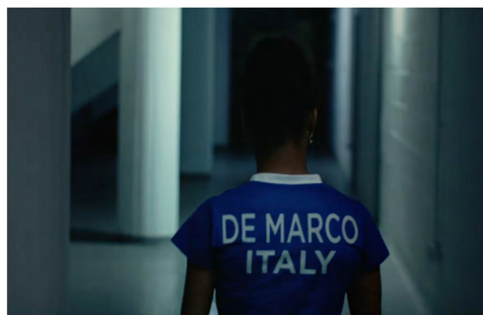
Dei frammenti del video