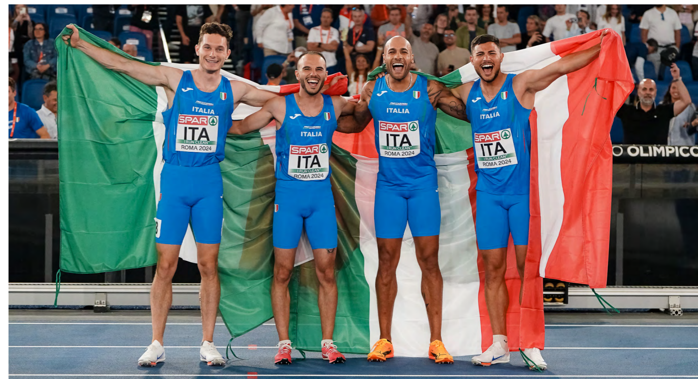
Con la staffetta regina a Roma 2024

Però, vista la regolarità e l'impegno prolungato, potrebbe facilitare più i mezzofondisti che gli sprinter.